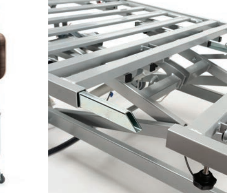
Facile smontaggio del telaio senza utensil