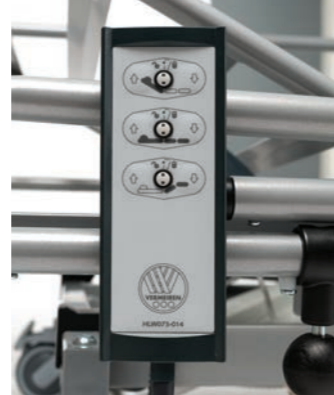
Semplice telecomando con funzioni di blocco