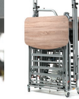
Un kit di trasporto su ruote per un facile spostamento del letto