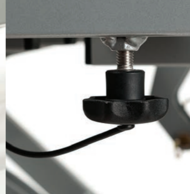
Viti in plastica a forma di stella per un facile montaggio del telaio