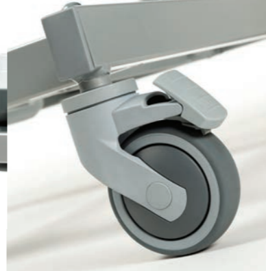
Solide ruote con freno